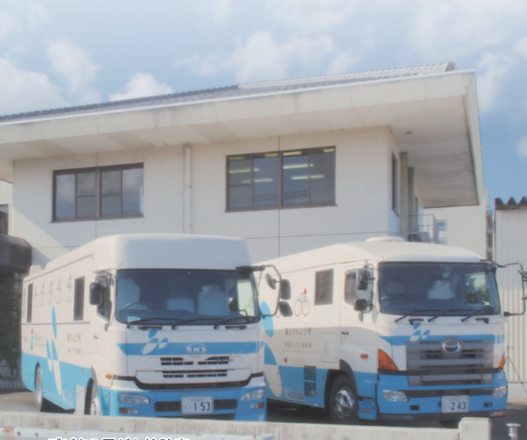
デジタル胃がん検診車

検査に関する内容についてご理解いただき、苦痛の少ない、安全で安心な検査、正確な結果をお渡しできる検査を行うことが出来るよう、これからも努力研鑽をまいります。と思っておりますので宜しくお願いいたします。