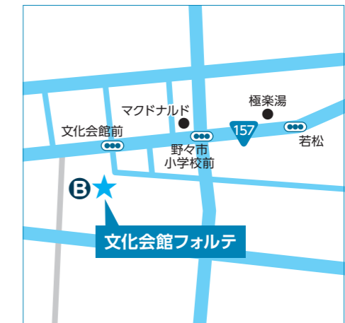
B 文化会館フォルテ 本町五丁目4番1号