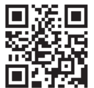
集団健診 予約状況確認サイト