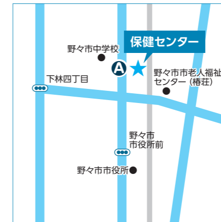
A 保健センター 三納三丁目128番地