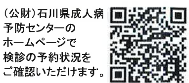
センターホームページ 閲覧用QRコード

予約先 (公財)石川県成人病予防センター 電話 076-237-6262 (受付時間:平日午前9時~午後5時) FAX 076-238-9207